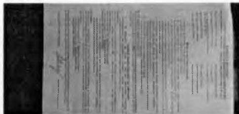
IMG-20200615-WA0000-1.jpg ~93 КБ