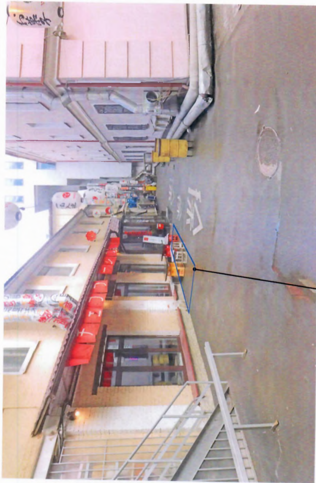
Зона существующего сезонного (летнего) кафе.