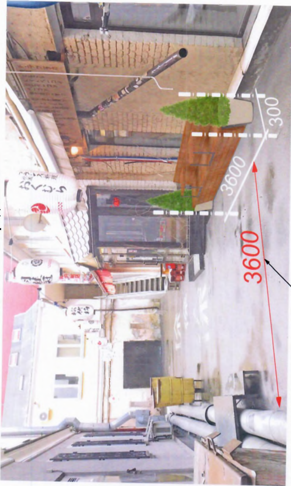
Ширина пожарного проезда*

* Согласно п.8.6. СП 4.13130.2013 - Ширина проездов для пожарной техники в зависимости от высоты зданий или сооружений должна составлять не менее: - 3,5 метров - при высоте зданий или сооружений до 13,0 метров включительно.