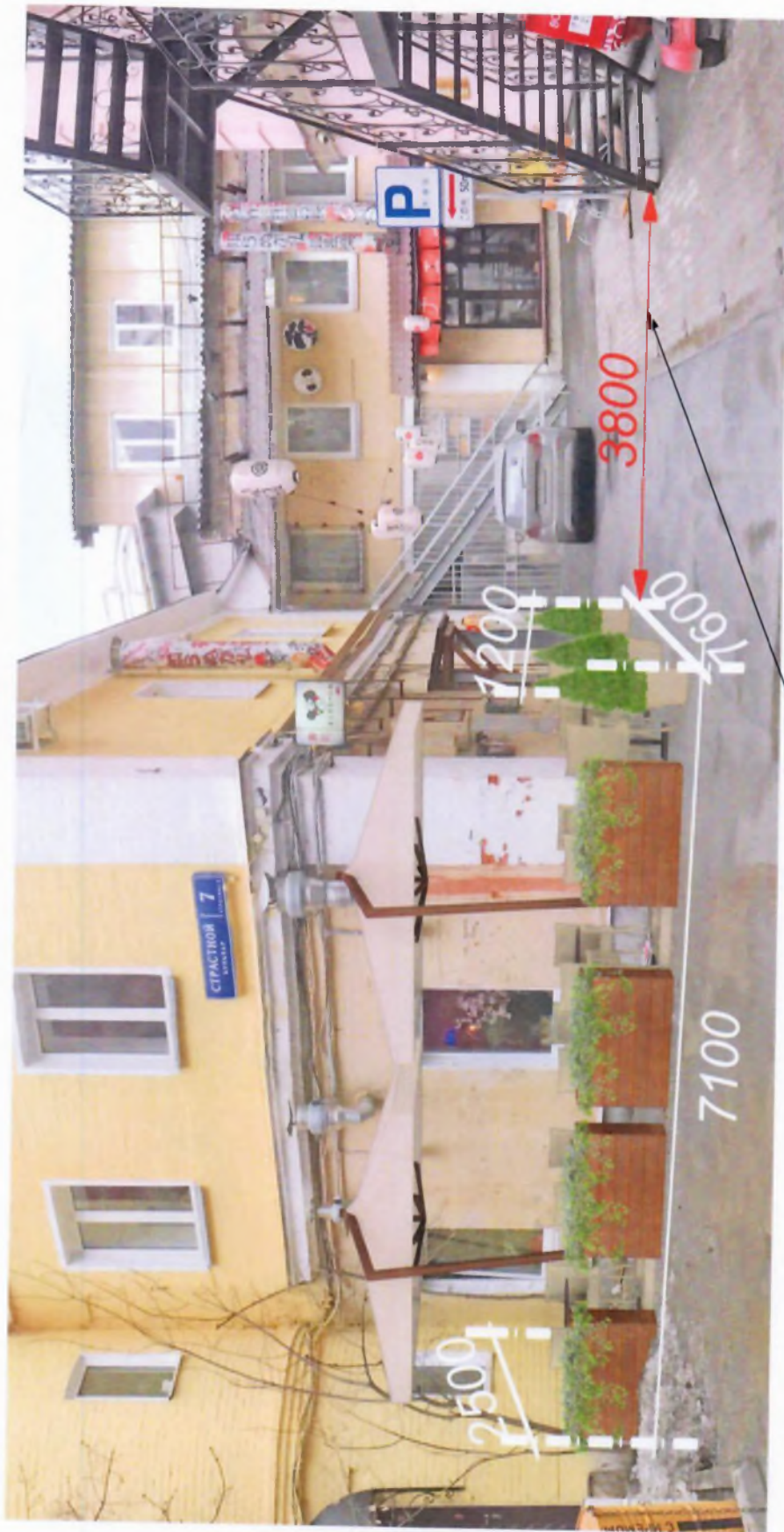
Ширина пожарного проезда*

* Согласно п.8.6. СП 4.13130.2013 - Ширина проездов для пожарной техники в зависимости от высоты зданий или сооружений должна составлять не менее: - 3,5 метров - при высоте зданий или сооружения до 13,0 метров включительно.