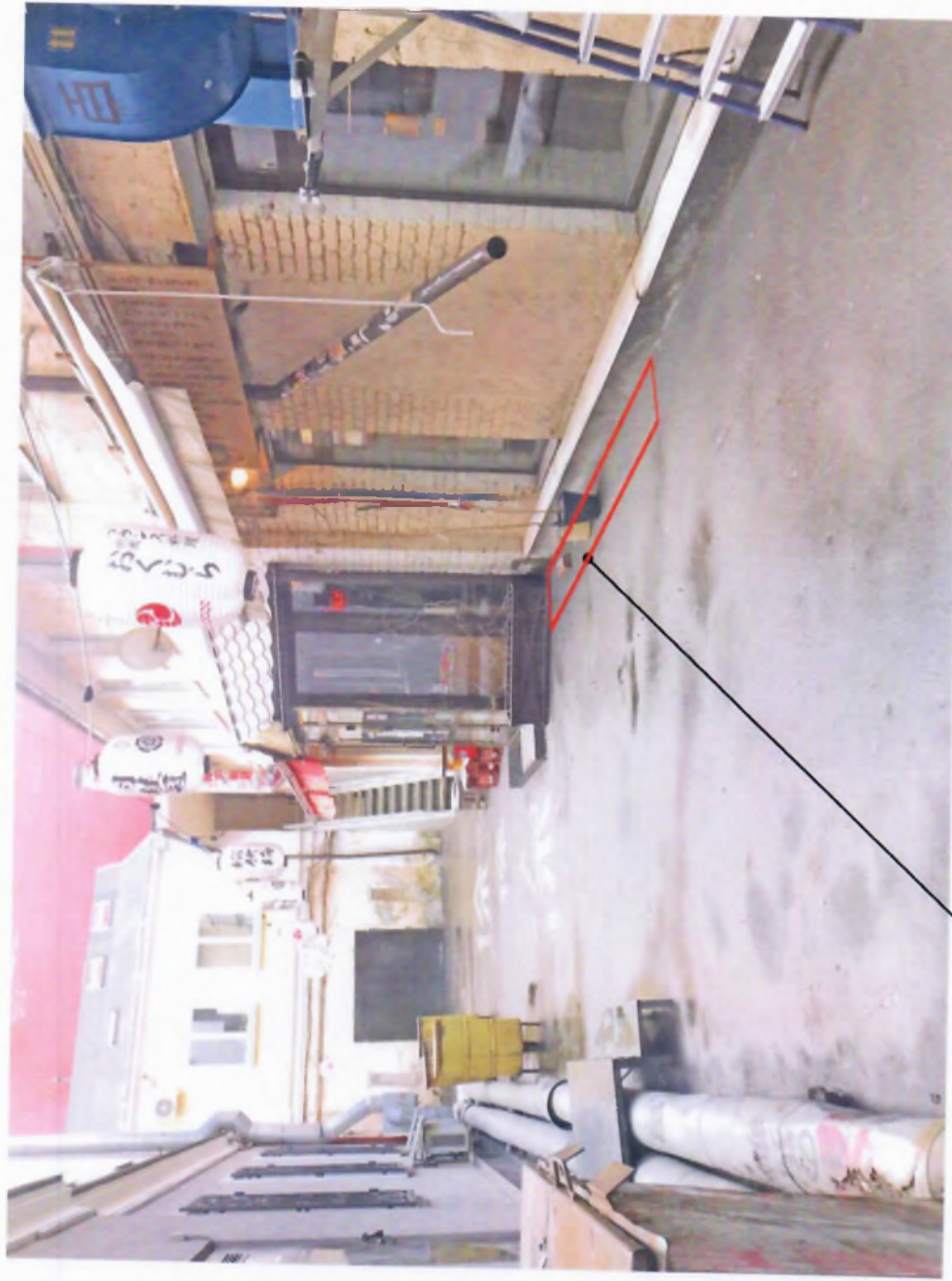
Зона размещения сезонного (летнего) кафе.