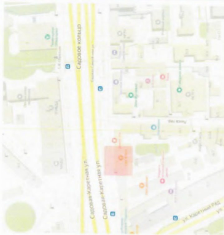
РАСПОЛОЖЕНИЕ В ГОРОДЕ