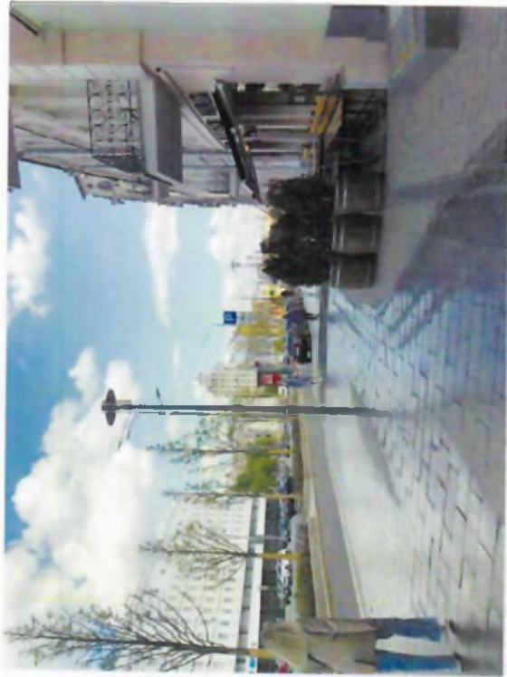
Площадка (Существующее положение)