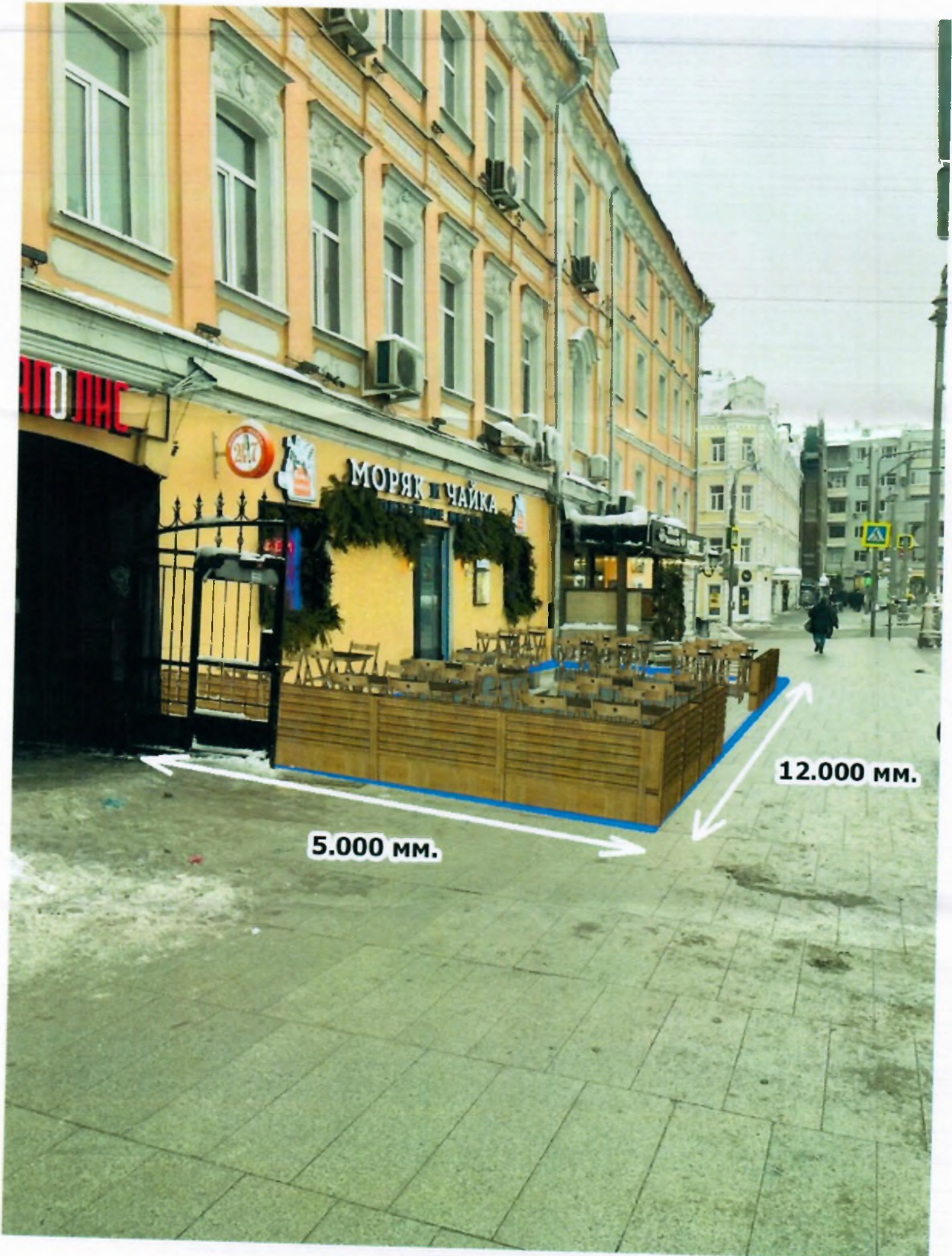
Размеры и фотопривязка