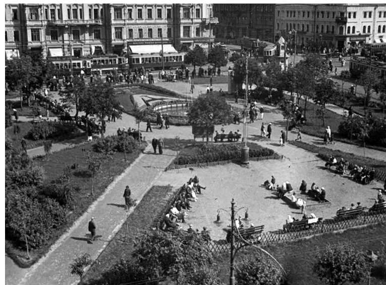
Площадь Белорусского Вокзала до 1951 года