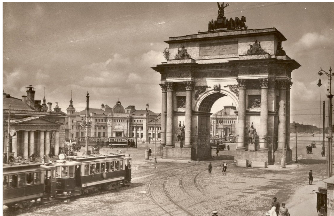
Так выглядела площадь в 1920-х годах

В 1834 году площадь была переименована в площадь Новых Триумфальных Ворот. Триумфальные ворота не раз путешествовали по Москве. В 1814 году на Триумфальной площади (той, что сейчас рядом со станцией метро «Маяковская») воздвигли Триумфальную арку в честь победы