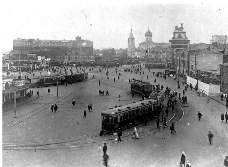
Площадь Белорусского Вокзала перед началом Великой Отечественной войны

его в 1951 году, в 2005-м перенесли в Парк искусств «Музеон», и вернули на прежнее место лишь двенадцать лет спустя.