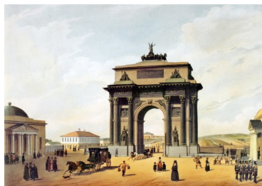
Триумфальная арка на площади Тверской Заставы, 1848 год (рисунок Н.Л. Бенуа)

Современная площадь Тверской Заставы возникла в 1742 году, когда строился Камер-Коллежский вал — часть таможенной границы Москвы. Кольцо валов и заставы должны были служить препятствием для нежелательного ввоза алкогольной продукции.