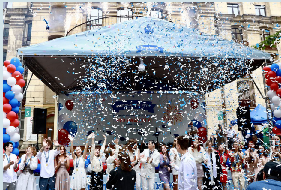
Выпуск 2023 года

Ребята учились выступать перед аудиторией, отвечать на сложные вопросы и на возражения, удерживать внимание аудитории, узнали о важности развития экологичного сознания и об ответственности при публичных выступлениях.